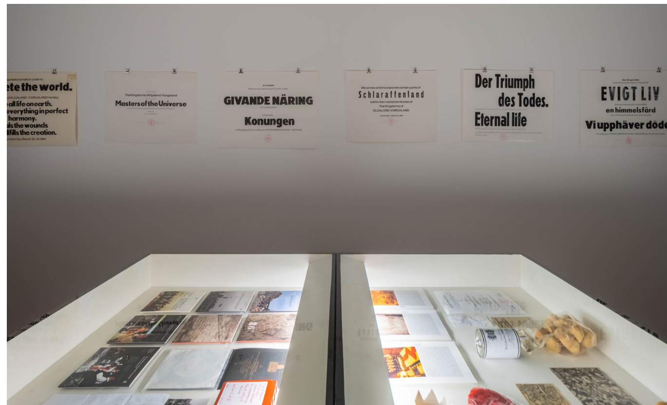
Från utställningen World Expo, Exposition Universelle på Accelerator

”Det finns exempel på hur konst har påverkat juridiken på miljörättsens område. På 1800-talet var landskapsmålningar populära i USA och Europa. De skildrade jättefina områden och utsikter, vilket kom att påverka inrättandet av de första naturreservaten i USA. Konstverken var ofta överdrivna och väldigt dramatiska, med stora berg och vattenfall. Det såg vi även i svensk konst från den tiden. När den första svenska naturskyddslagstiftningen kom i början av 1900-talet så var den formulerad på så sätt att den skyddade just det unika och dramatiska i landskapet. Det var lite som «Nils Holgerssons underbara resa», där de unika och specifika landskapen skildras. Konsten bidrog här till att naturmiljön skyddades och hur den skyddades. Det är ett bra exempel på hur konstnärlig gestaltning påverkar vårt förhållande till omgivningen.”