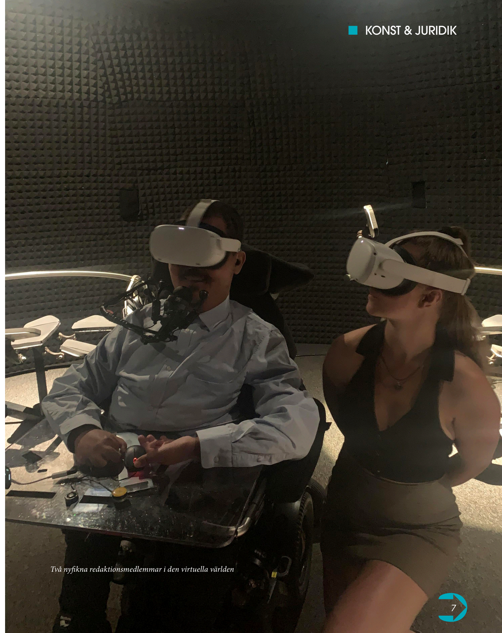
Två nyfikna redaktionsmedlemmar i den virtuella världen