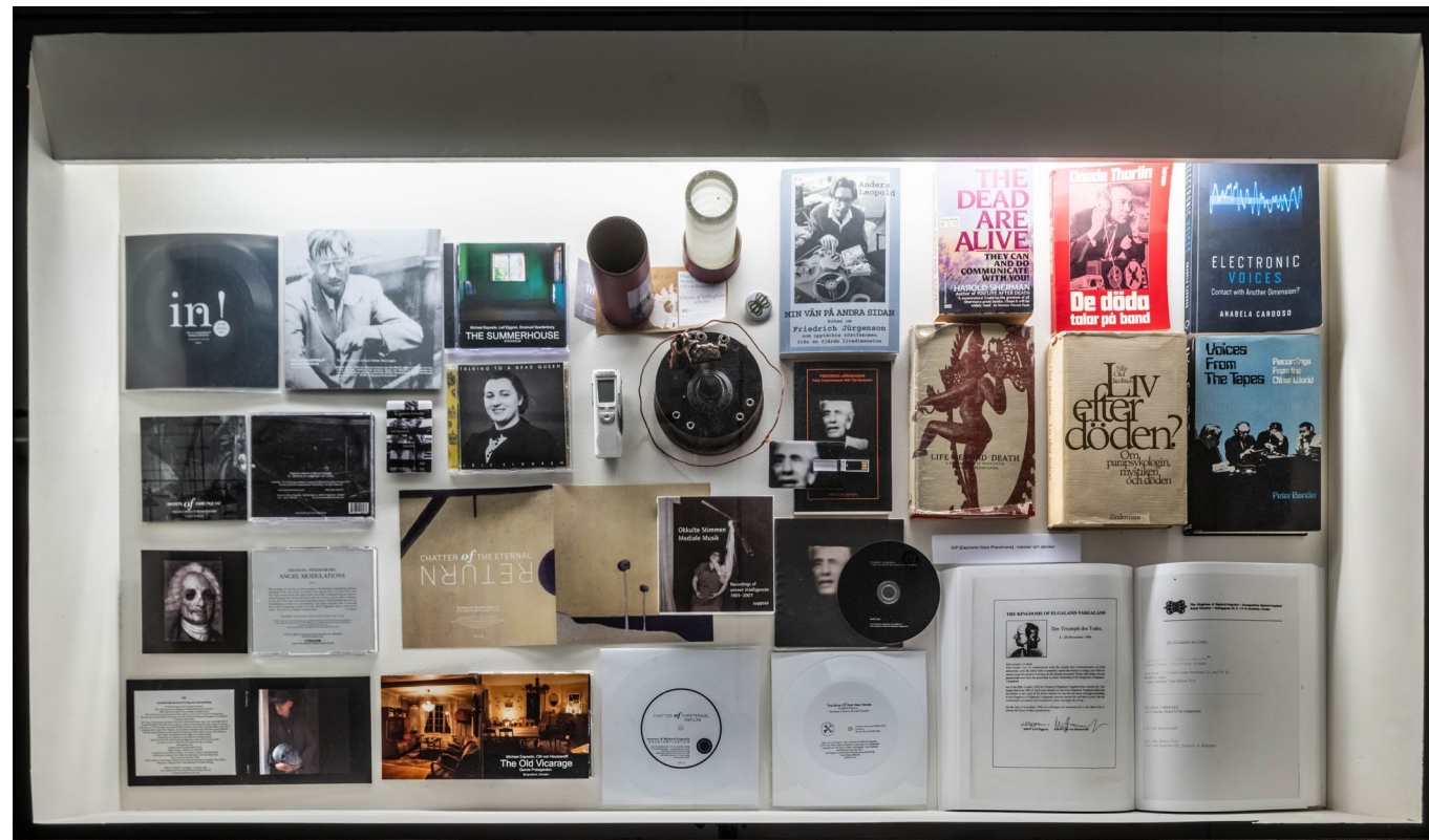
Från utställningen World Expo, Exposition Universelle på Accelerator